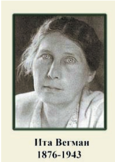
Іта Вегман 1876-1943