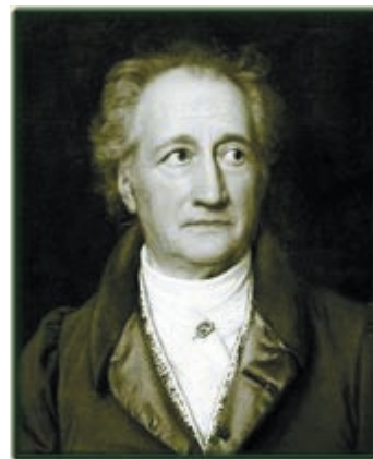
Йоганн Вольфганг фон Гёте (1749-1832)

Следующим этапом в становлении личности стали естественнонаучные работы Гете. Под руководством Штай-